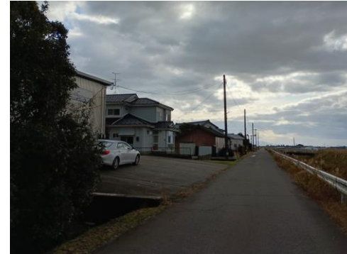
建物（296番）平成3年9月19日築