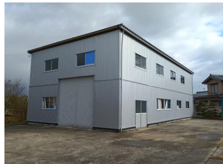
建物（296番の2）平成8年3月30日築

床面積 163.24㎡ 天井高 約6.3m 搬入口シャッター 高さ約3.5m 幅約3.45m