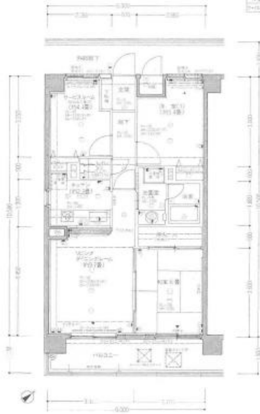
※Eタイプ②北西向き併設可、※Eタイプ①北東向き併設可