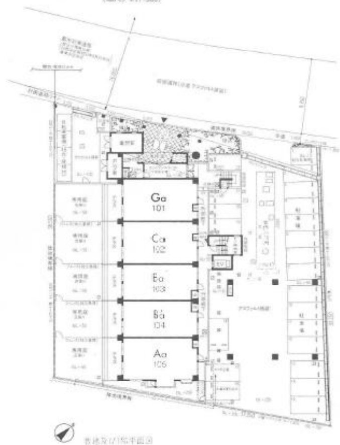
敷地及び1階平面図